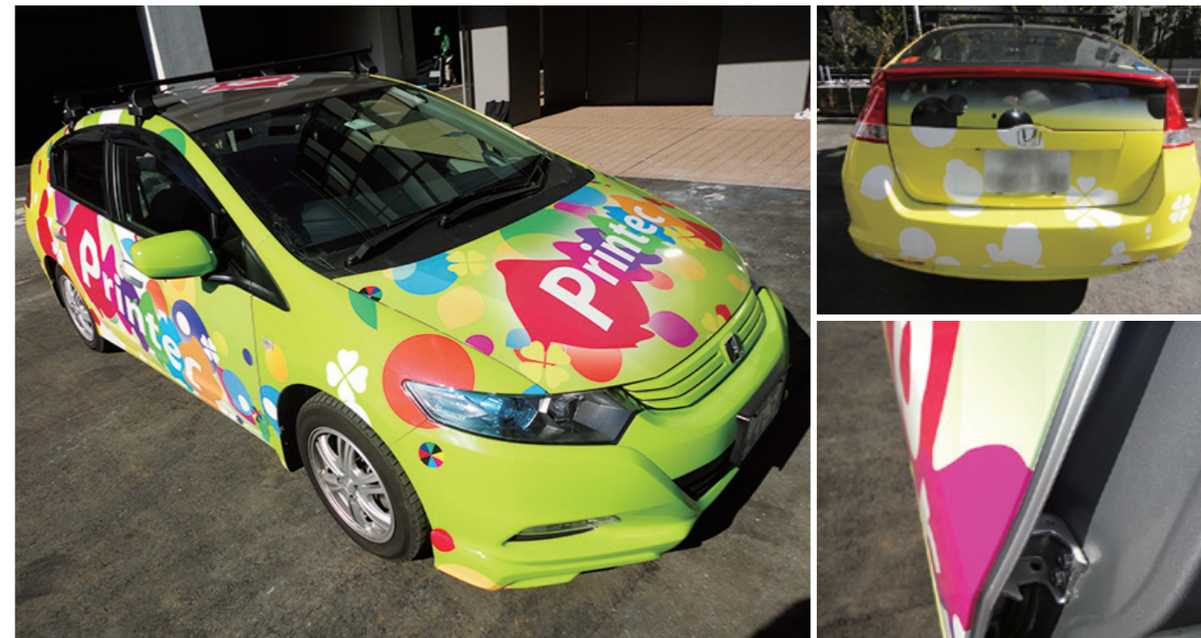
ヴェラップス MG_インサイトラッピング施工事例。

施工性に優れた塩ビタイプと環境負荷に配慮したアクリルタイプの2種類を使い分けることで、幅広いラッピング用途への提案が可能となっている。