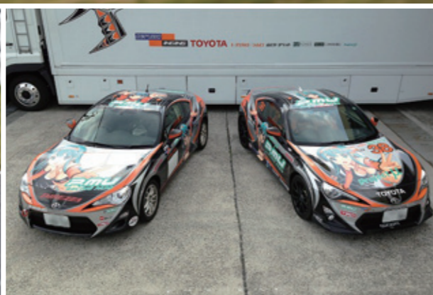
トヨタカローラ山口レーシングチーム「INGING」イメージキャラクターのラッピングを実施。過酷なレースカーへの装飾にも耐えうる耐候性を備えている。