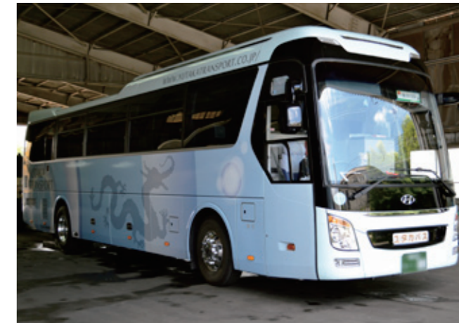
ヴェラップス PVC_バスラッピング施工事例。