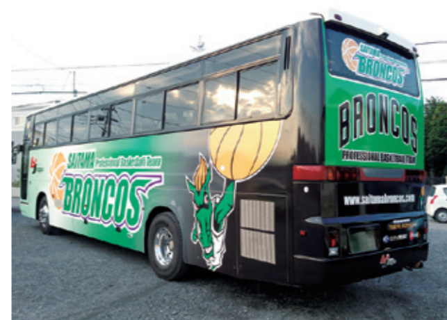
ヴェラップス PVC_ブロンコのバスラッピング施工事例。